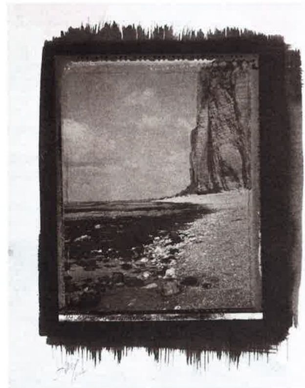
Siderargent sur papier Bergger Cot 160, d'après un négatif argentique 4x5". Étretat, plage et falaise de Bénouville.